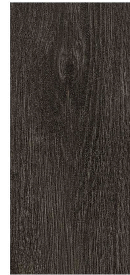
w60074 | black rustic oak