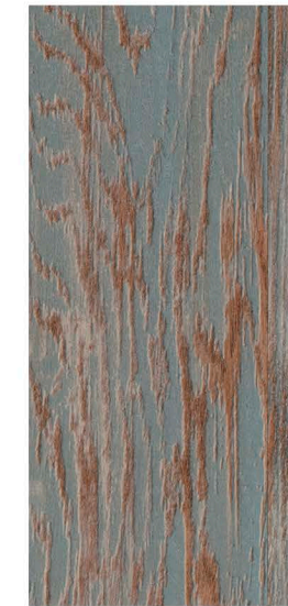
w60164 | blue reclaimed wood