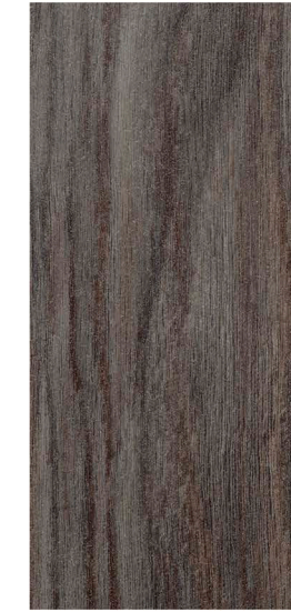
w60185 | anthracite weathered oak