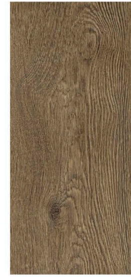
w60078 | light rustic oak