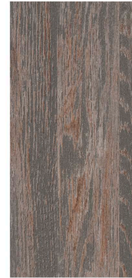
w60161 | gray reclaimed wood