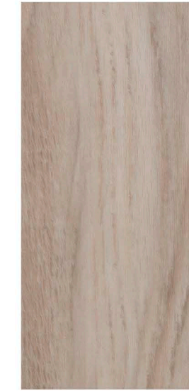
w60186 | white weathered oak