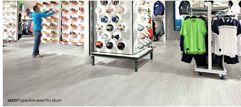
s62357 | grey lime stone 75 x 50 cm