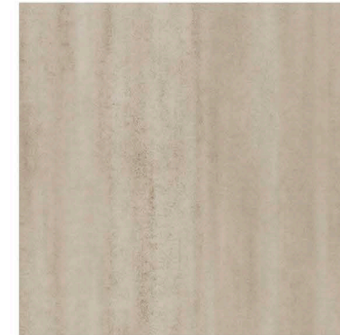
s62356 | desert limestone