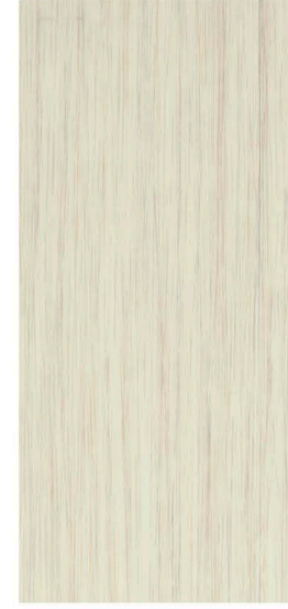
w61259 | white seagrass