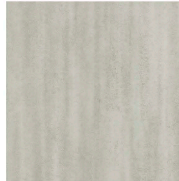
s62357 | grey limestone