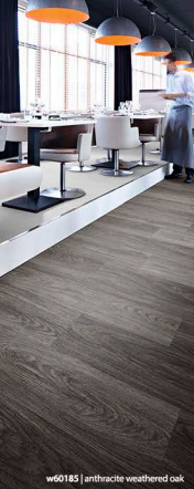
w60185 | anthracite weathered oak