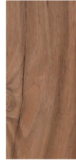
w60302 | deep contry oak