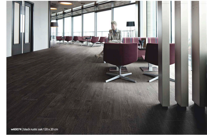
w60074 | black rustic oak 120 x 20 cm