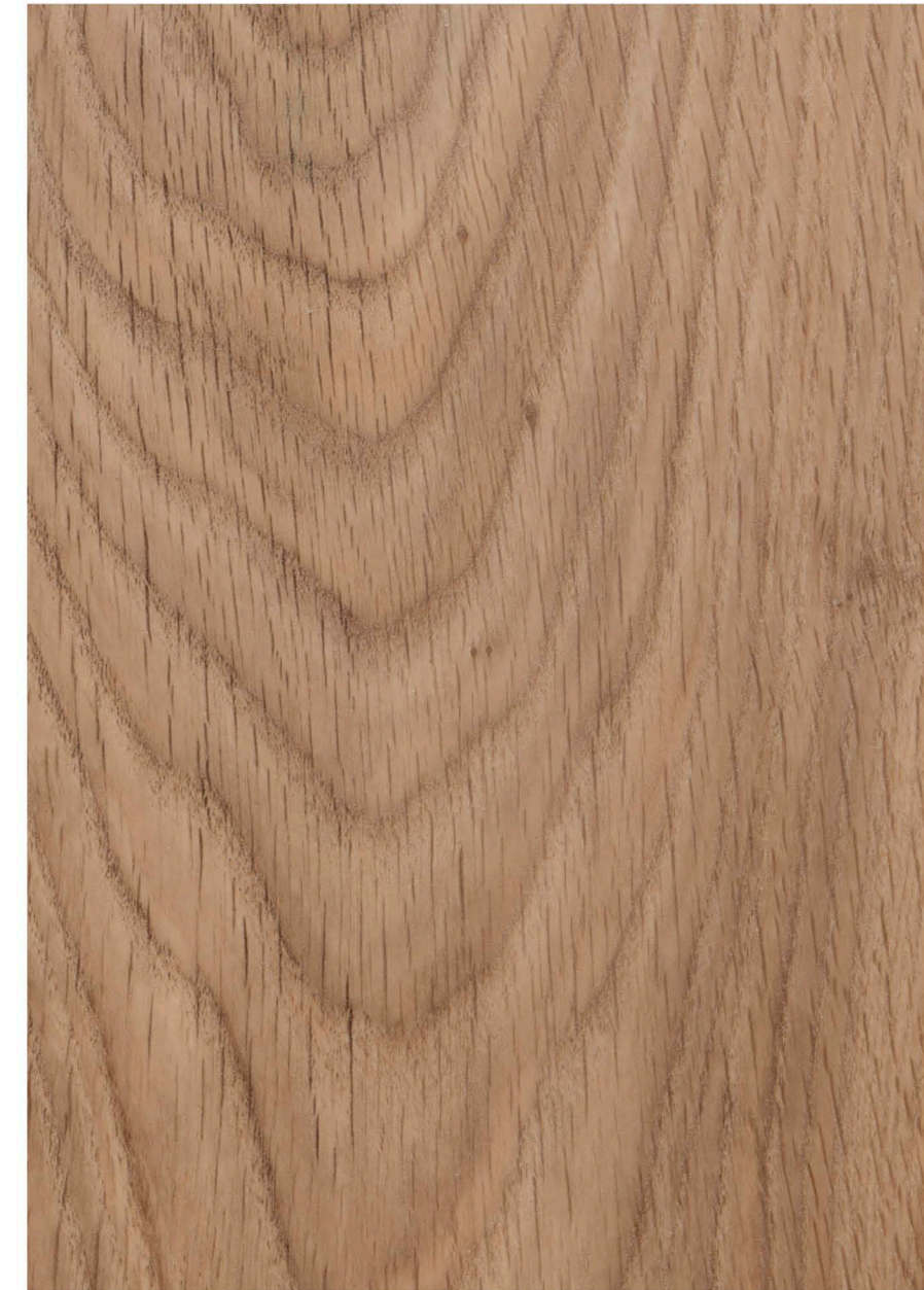
w60300 | central oak