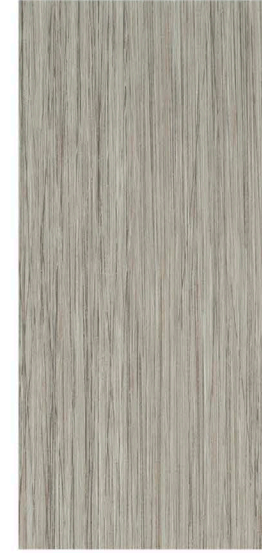
w61253 | oyster seagrass