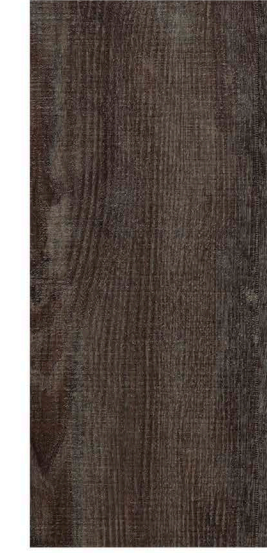
w60154 | anthracite raw timber