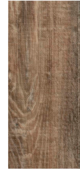
w60153 | natural raw timber