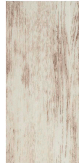
w60163 | white reclaimed wood