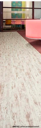
w60163 | white reclaimed wood