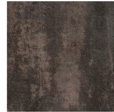
s62429 | warm metal