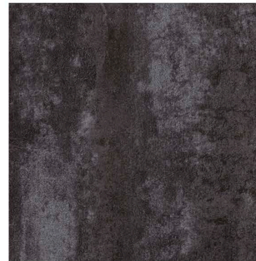
s62425 | cool metal