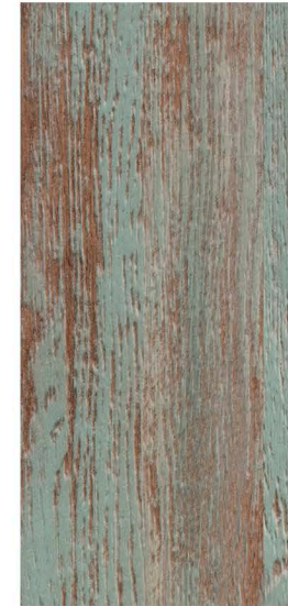
w60166 | green reclaimed wood