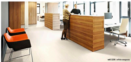
w61259 | white seagrass