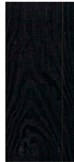
w60128 | solid oak charcoal